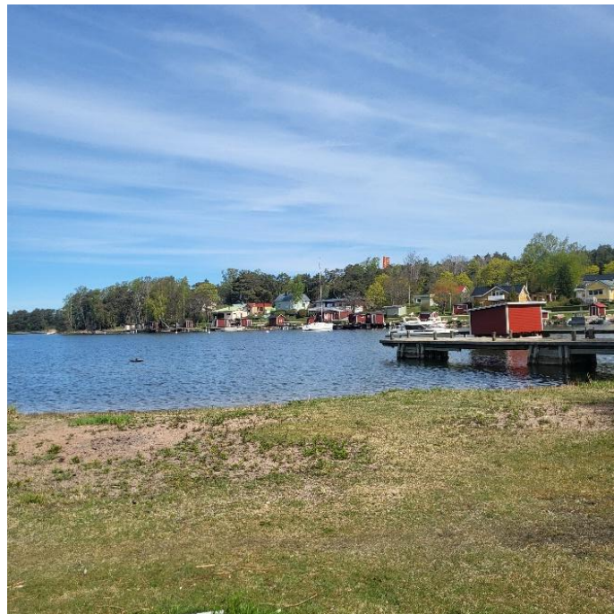
Kapellhamnen och Riviln