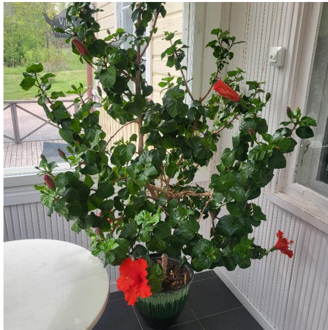
En prunkande hibiscus på Villa Kosthålls veranda

Som sista programpunkt åkte vi till Villa Kosthåll, där vi bjöds på kaffe med hembakt bulle. En lugn stund att njuta av livets goda i vårens skira grönska efter en händelserik dag, fylld av kontraster och delvis skakande upplevelser.